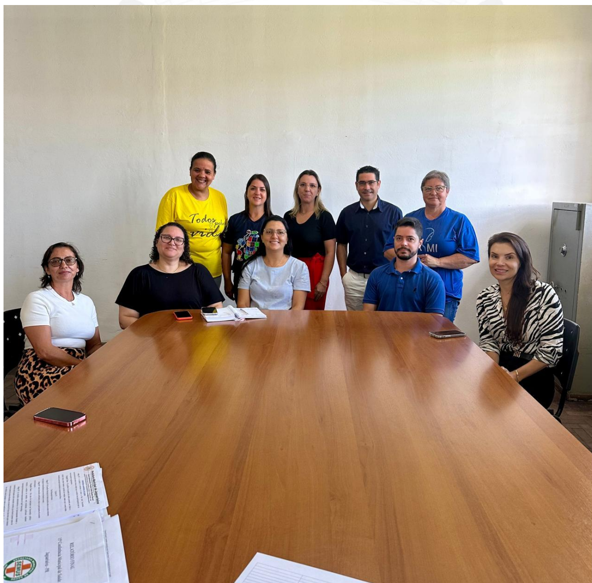
Foto da Reunião do Conselho Municipal de Saúde – realizada no dia 21/01/2025 - sobre a organização da Conferência de Saúde.

Total de Despesas para a realização da 15ª Conferência Municipal de Saúde – R$ 20.467,50